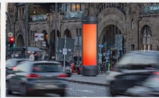
PV CITY TOWER