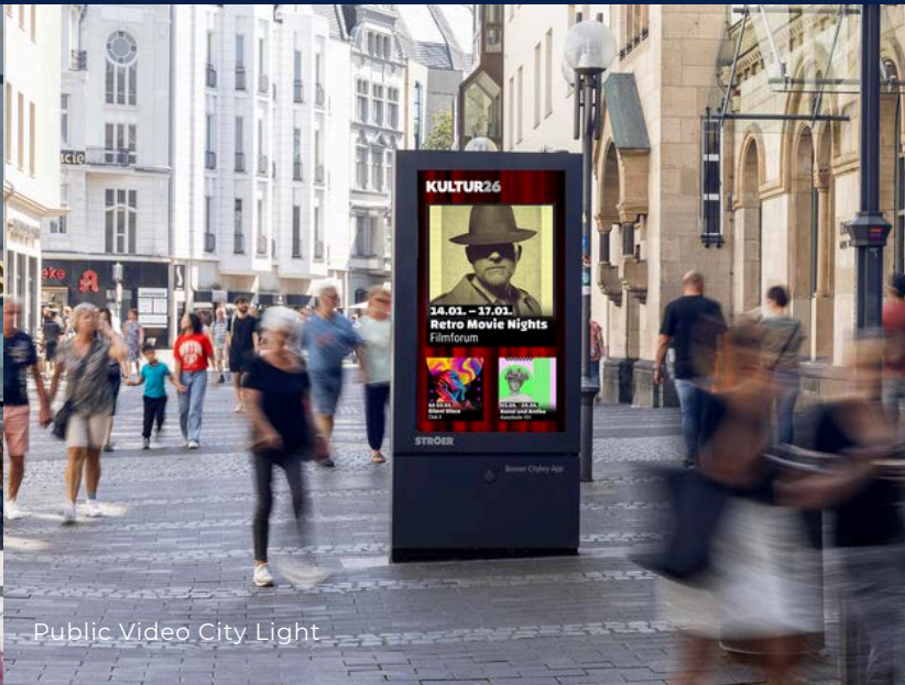
Public Video City Light