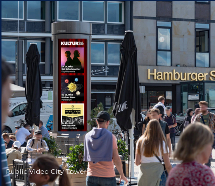
Public Video City Tower