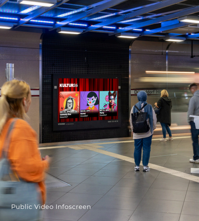
Public Video Infoscreen