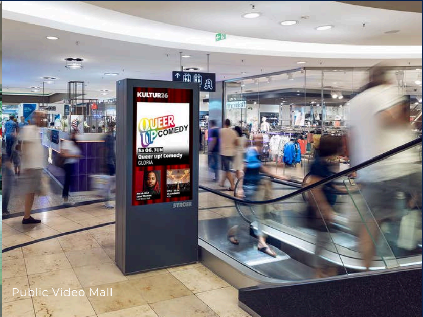
Public Video Mall