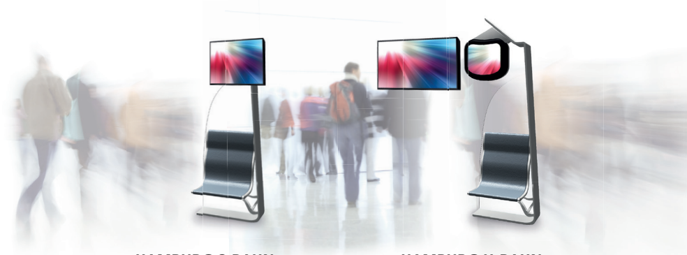
HAMBURG S-BAHN 4:3 Format: 1440 × 1080 Pixel